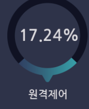
어플리케이션 추가된 패턴 수(IP/Port)