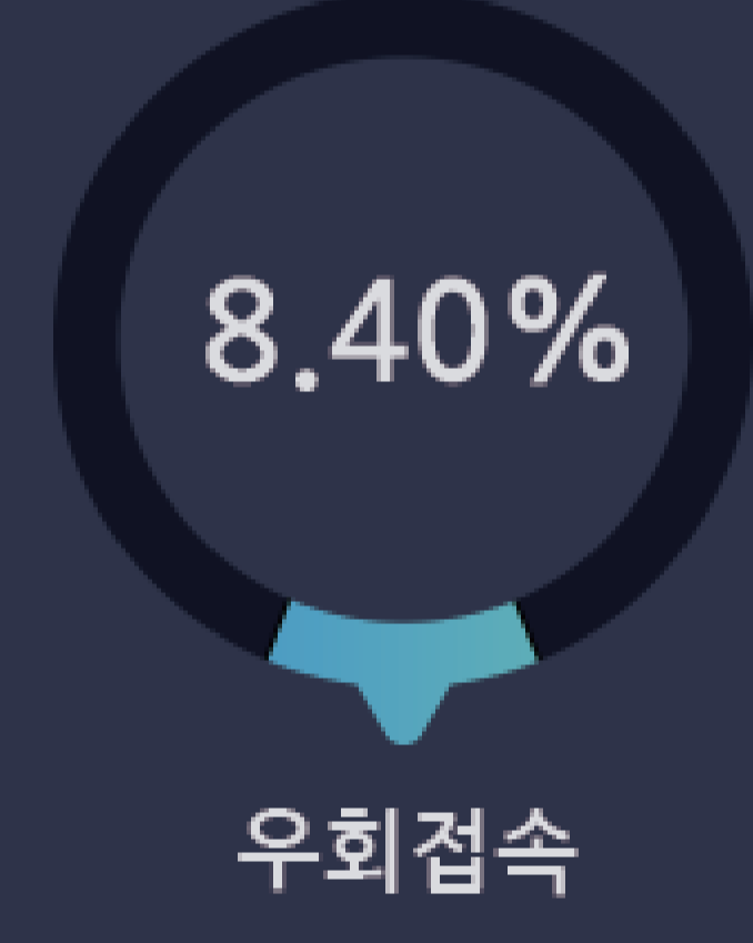
어플리케이션 추가된 패턴 수(IP/Port)