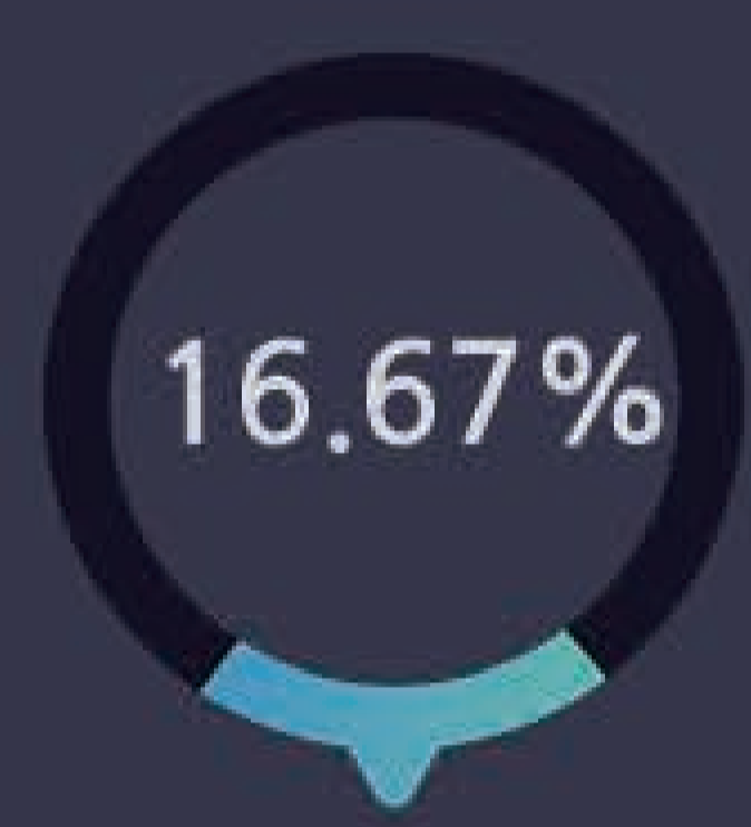
어플리케이션 추가된 패턴 수(IP/Port)